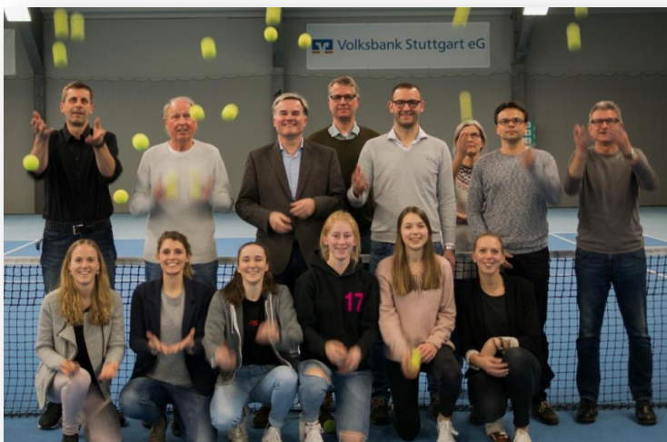
Die Vorstandschaft des TCW

Ausgesprochen gute Stimmung herrschte bei der Mitgliederversammlung des TC Winnenden