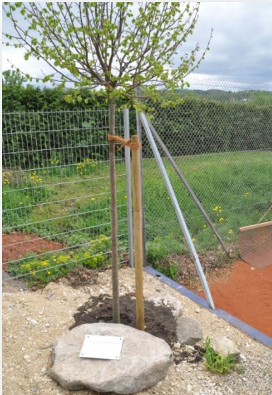
Linde und Gedenktafel am Eingang

Vom 26.-28. April ist der TCW mit einem hochrangigen Leistungsklassenturnier der Herren, mit einer Kooperationsveranstaltung für Kleinkinder und mit einer Gedenkveranstaltung für