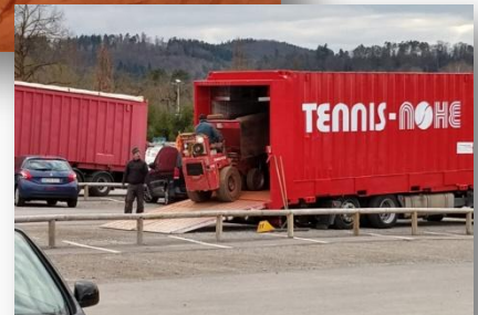
Vorbereitung der Plätze für die Sommersaison 2019